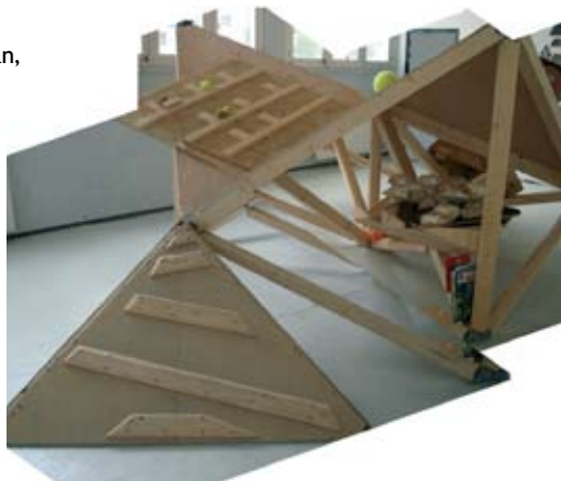
Ernesto Sartori Table de découpe

JEAN-CHRISTOPHE BAILLY, écrivain et enseignant à l'École nationale supérieure de la nature et du paysage à Blois, le jeudi 19 juin à 18h18 .