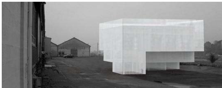
Open climate, implantation du pavillon de 92m2 sur l'île de Nantes. Projet : 2006.